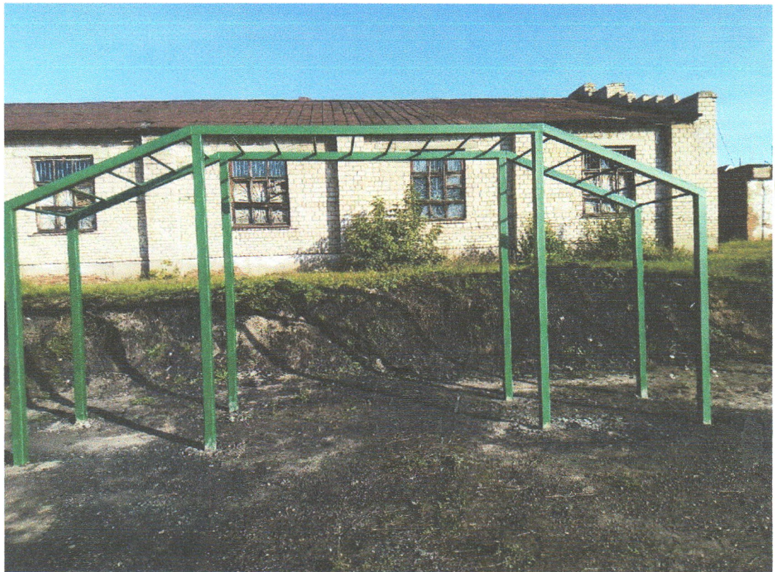
Фото 3. Кроссфит (рукоход) – 6000х1000х2600мм