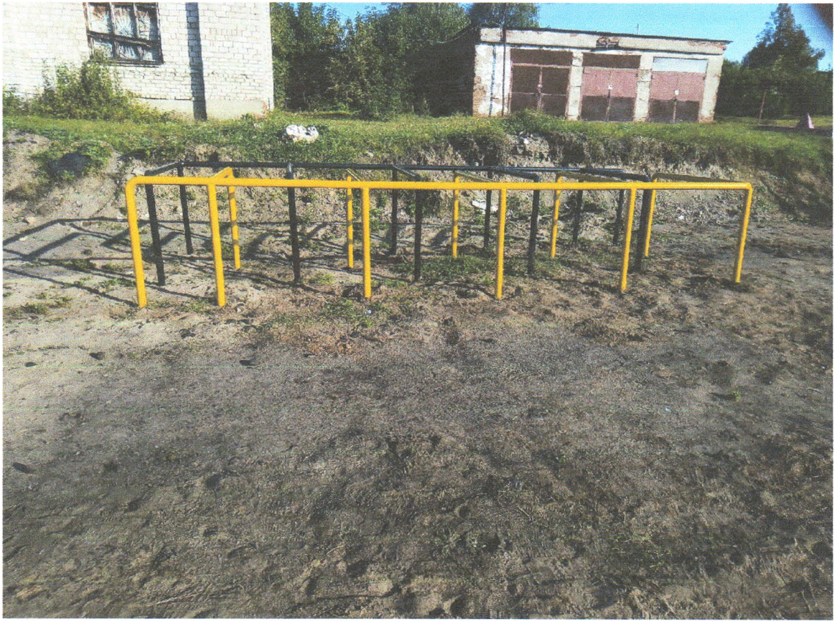
Фото 2. Лабиринт – 6000х2000х950мм