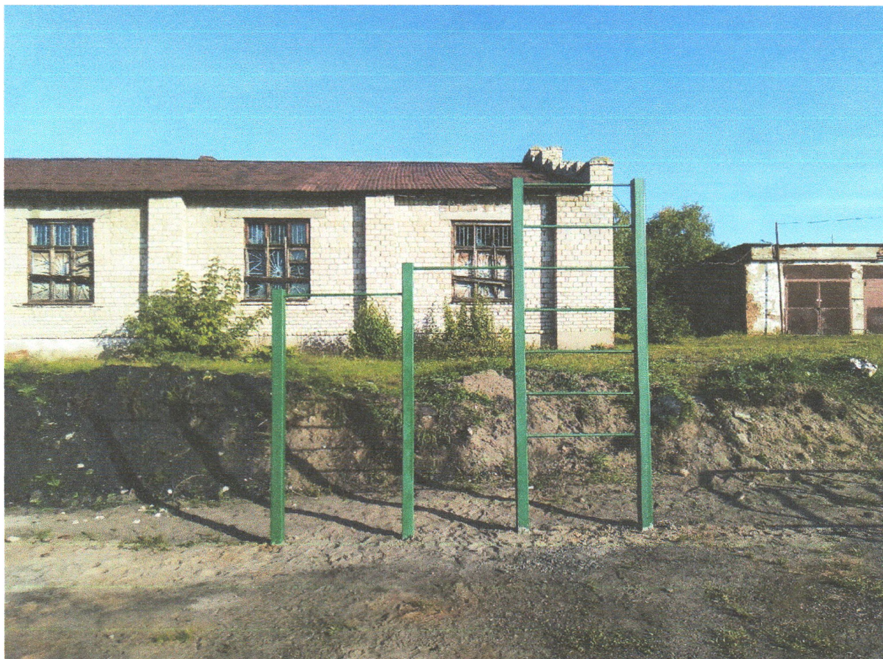
Фото 1. Спортивный комплекс: турник – 950x2150мм; турник – 1000x2300мм; гимнастическая стенка – 950x3100мм