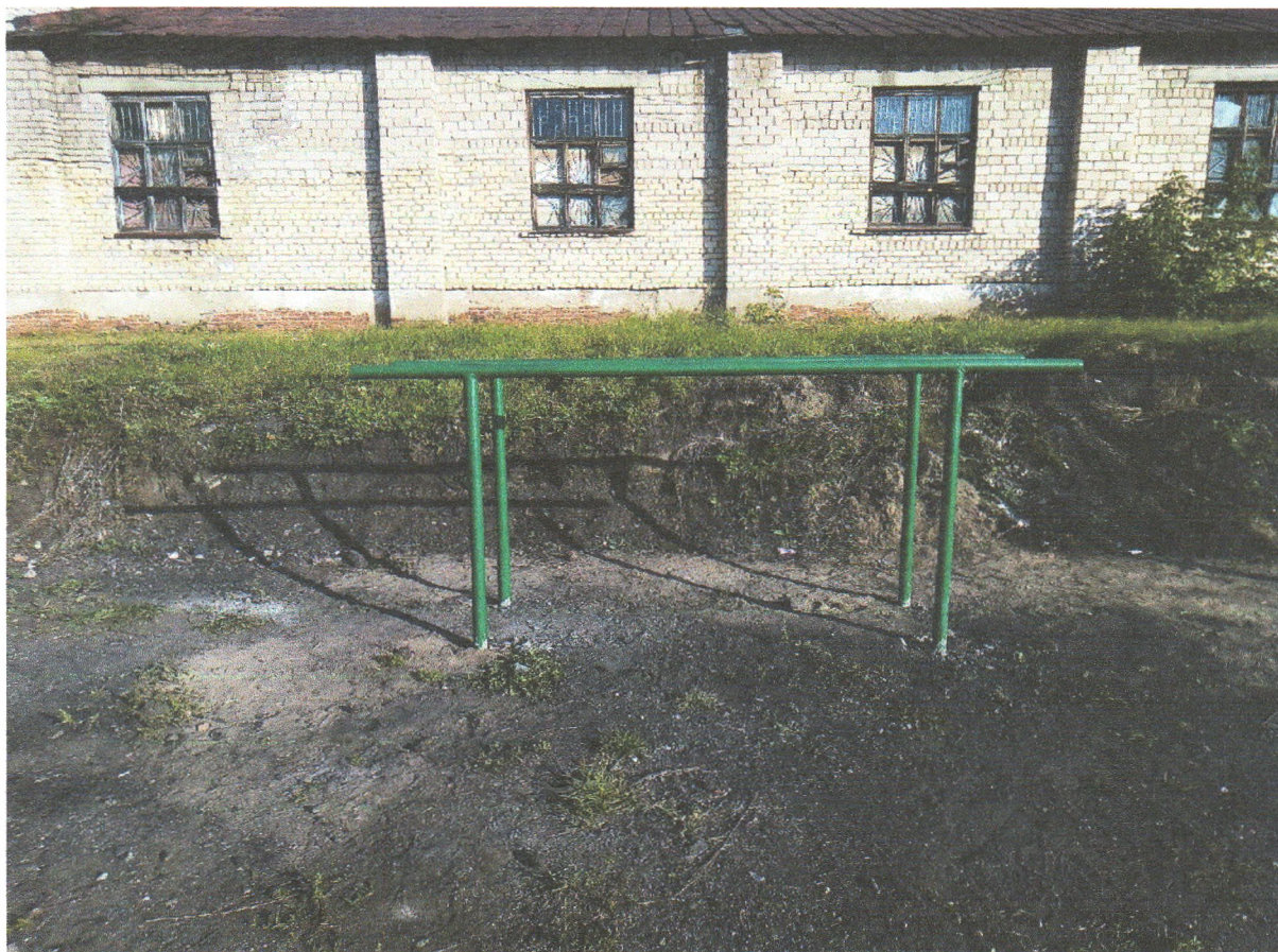
Фото 4. Брусья – 2900x1200x580мм;